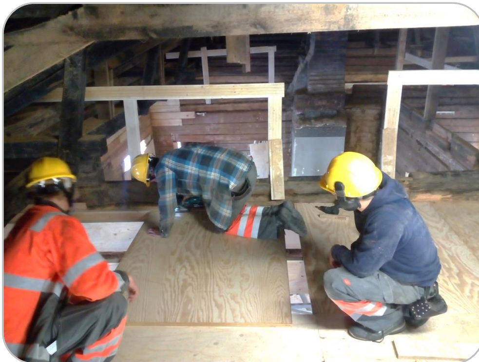
Baustelle in Turku

Neben tollen Eindrücken von Land und Leuten, ging es natürlich auch darum, die Arbeitsweisen im Ausland kennen zu lernen. Damit dies auch gewährleistet war, arbeiteten die Auszubildenden nicht etwa in Ausbildungszentren, sondern in Kooperationsbetrieben und dort direkt auf den Baustellen.