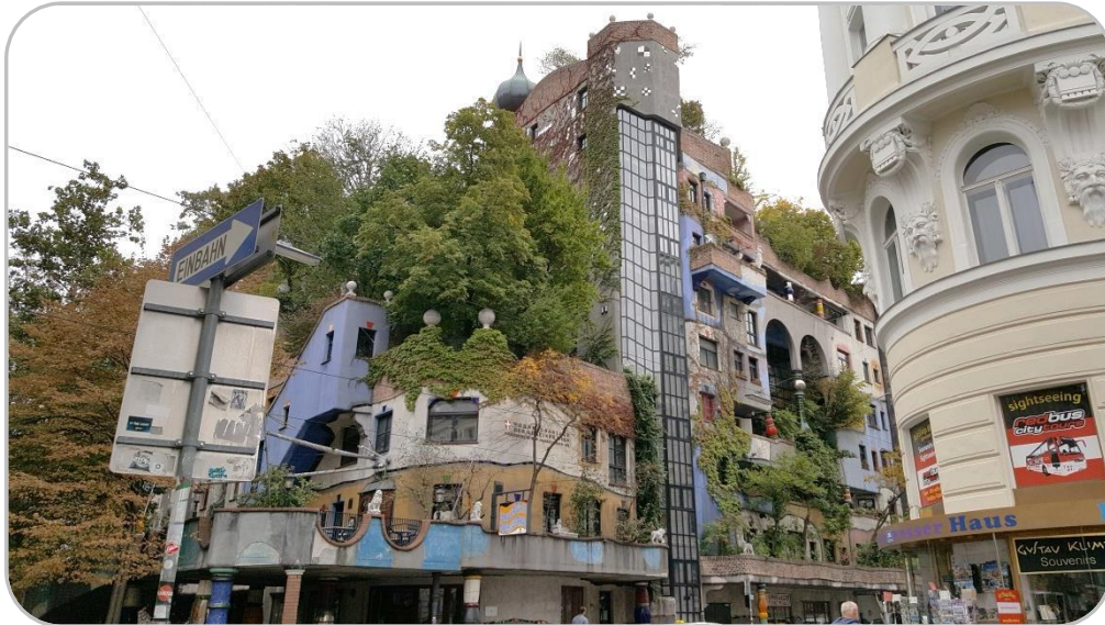
Das Hundertwasserhaus in Wien

Wie bereits in den Vorjahren, haben wir auch in diesem Jahr wieder Auszubildende des 2. Lehrjahres in die Ferne geschickt.