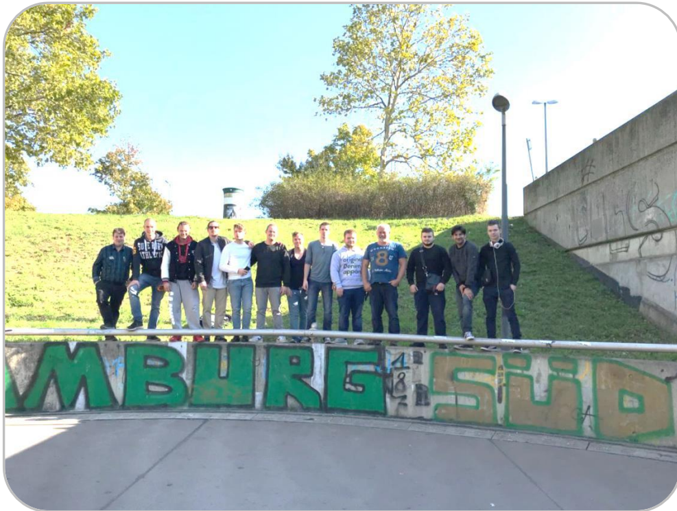
Gruppenfoto in Wien

Nachdem alle Auszubildenden zwei Wochen später, am 30.09.2017, gesund und munter nach Hamburg zurückgekehrt sind, haben uns in der Nachbesprechung die Meinungen und Aussagen der Azubis und der Begleitpersonen wieder eindeutig gezeigt, dass ein solcher Austausch sowohl auf fachlicher Ebene, als auch für die soziale Entwicklung ein absoluter Gewinn ist und auch in den kommenden Jahren sicher erneut durchgeführt werden wird.