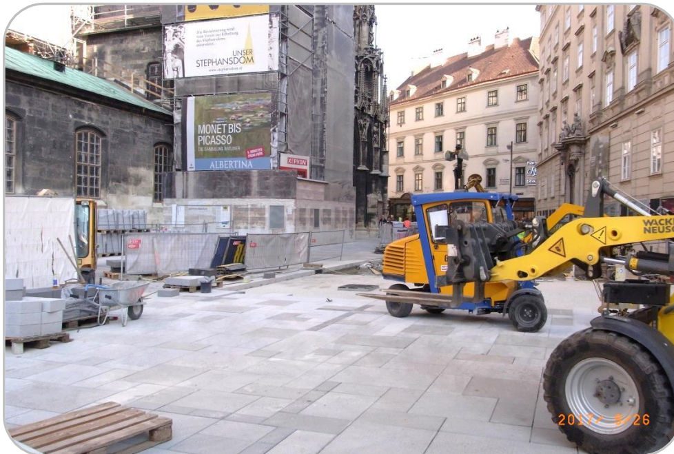
Baustelle in Wien

Neben tollen Eindrücken von Land und Leuten, ging es natürlich auch darum, die Arbeitsweisen im Ausland kennen zu lernen. Damit dies auch gewährleistet war, arbeiteten die Auszubildenden nicht etwa in Ausbildungszentren, sondern in Kooperationsbetrieben und dort direkt auf den Baustellen.